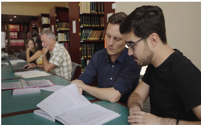
Les Doléances, un film d'Hélène Desplanques

Né d'une demande directe de citoyens et citoyennes issus du mouvement des Gilets jaunes, le projet d'analyse participative des cahiers de doléances redonne voix à ces milliers de textes rédigés entre 2018 et 2019. Lorsque cette initiative voit le jour en 2020, près de 2 000 personnes en Gironde et en Creuse se sont portées volontaires pour contribuer à la transcription collective des archives départementales, étape préalable à une analyse approfondie des thématiques, des registres et tonalités des écrits par les scientifiques à l'aide de logiciels lexicométriques. Soutenu par la Fondation de France et la région Nouvelle-Aquitaine, le projet s'étendra à d'autres territoires d'ici 2028, et a déjà permis le financement d'autres programmes de recherche dans la continuité de ces travaux ainsi qu'à des ateliers de formation et d'échanges en collaboration avec les archives départementales.