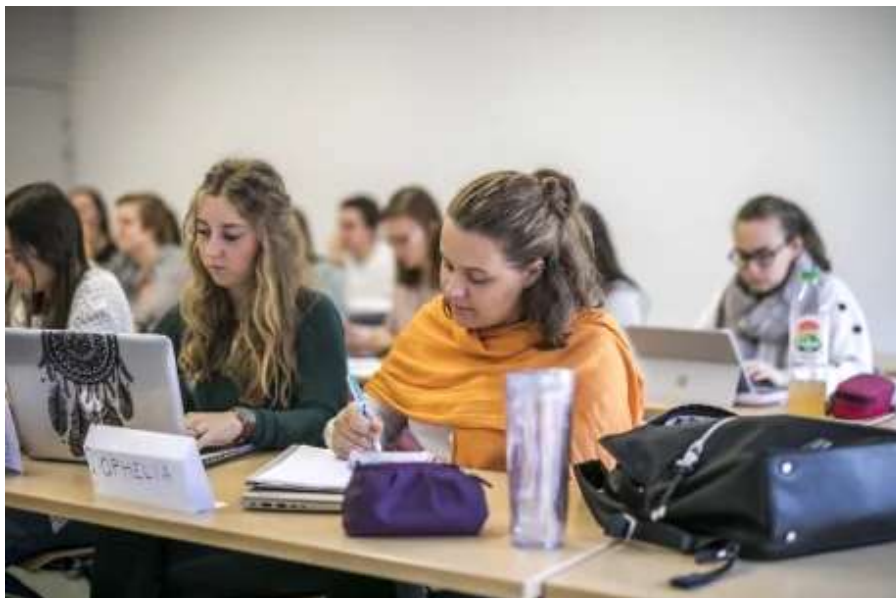
© France Universités - Université de Haute-Alsace

Imprimé par Xavier Teissedre - abonné #13929 - le 21/06/2024 à 09:14