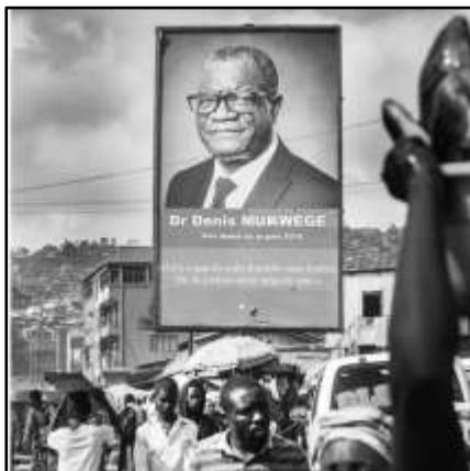
Photo réalisée par Christophe Smets à Bukawu au Sud-Kivu Denis Mukwege, prix Nobel de la Paix, ancien étudiant de la Faculté de santé de l'UA, formé au métier de gynécologue au CHU d'Angers, sera de retour à Angers les 9 et 10 mai prochains à l'occasion de la fête de l'Europe notamment. Au programme de ces deux jours : deux conférences, un ciné débat et l'inauguration d'une exposition de photographies inédites.