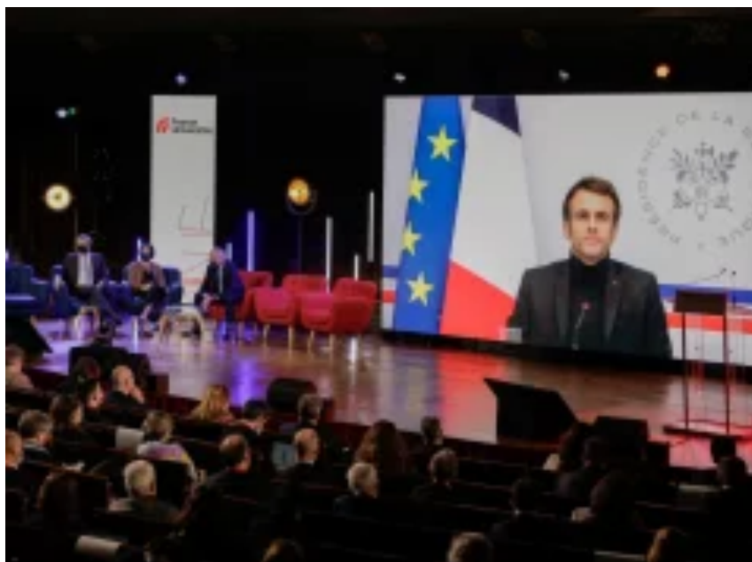
Emmanuel Macron en clôture du Congrès des 50 ans de France Universités, le 13/01/2022