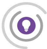
Schéma Régional Enseignement Supérieur, Recherche, Innovation