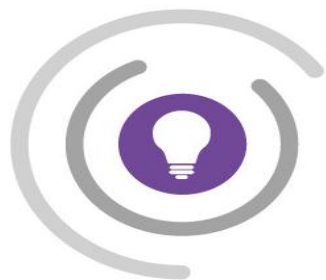
Schéma Régional Enseignement Supérieur, Recherche, Innovation